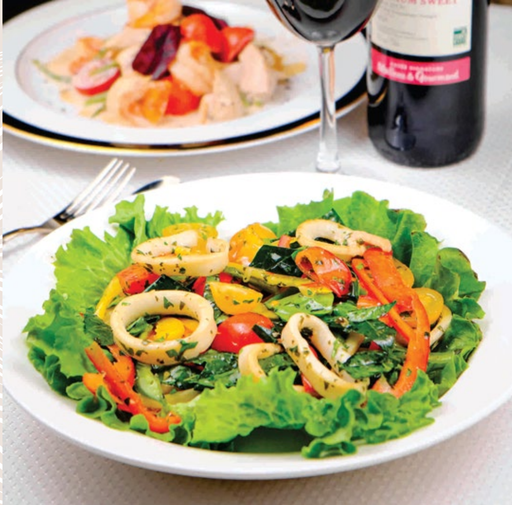
Салат с кальмарами и овощами