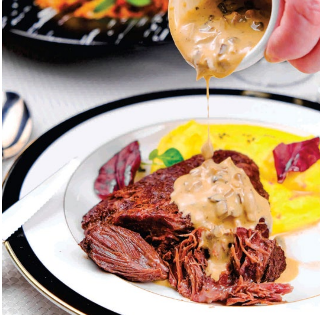
Томленые говяжьи щёчки с грибным соусом