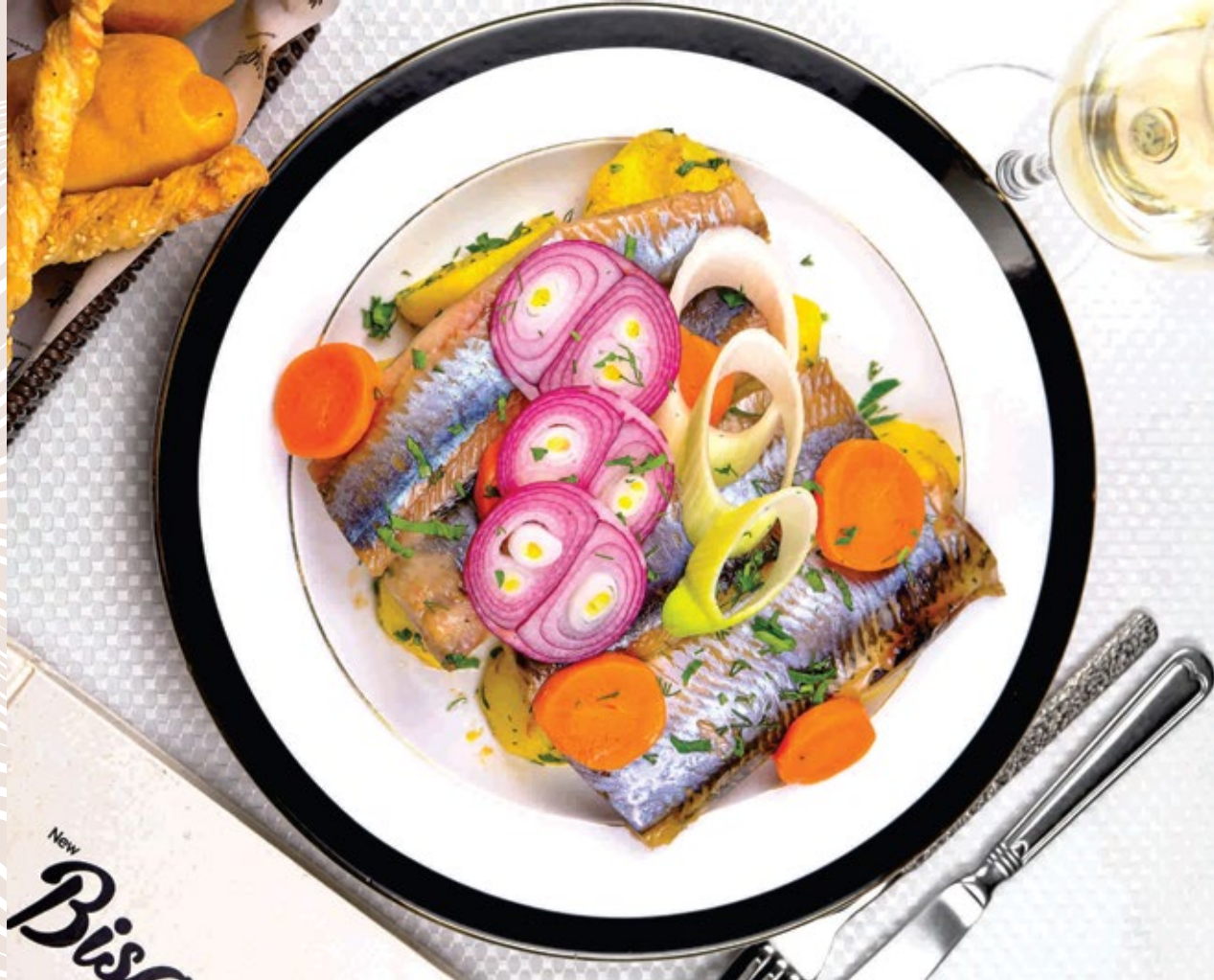
Селёдка малосольная с отварным картофелем с красным луком