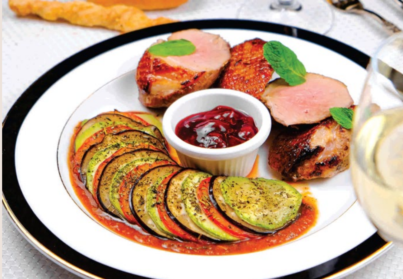
Утиное филе с ратотуем