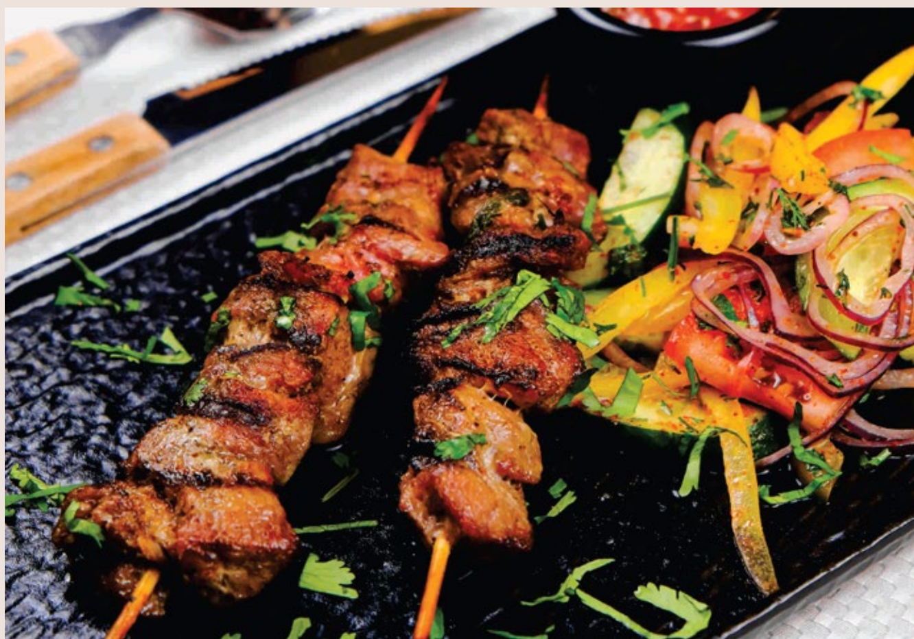
Шашлычки из баранины с салатом из овощей