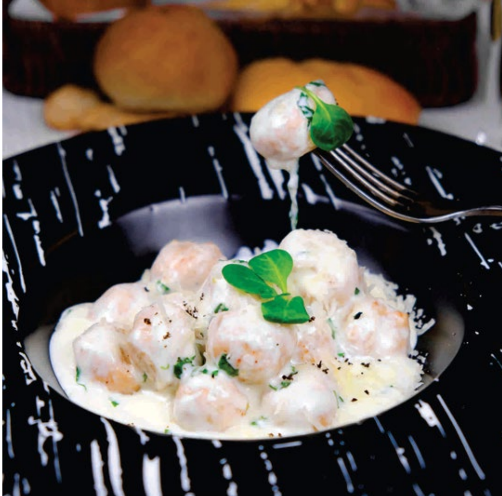
Итальянские фрикадельки куриные в сырном соусе