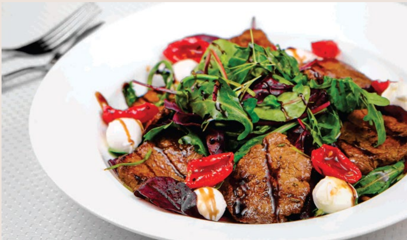
Салат Бизон с вырезкой говядины с сыром моцарелла и вяленые черри