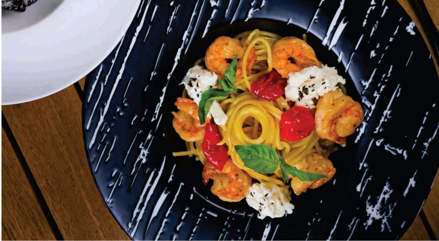
27 Спагетти с креветками, вяленые помидоры черри и сыр страчателла