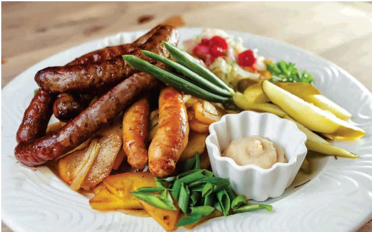
Колбаски на гриле

Домашние колбаски с жареным картофелем, квашенной капустой и горчичным соусом