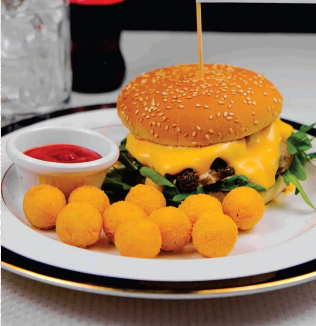
Царь бургер с тремя видами сыра