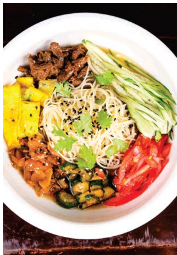
Кукси по-корейски 3 490