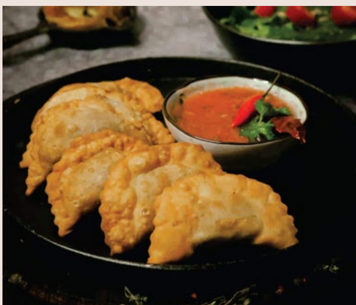
Мини-чебуреки (5 шт) 2 690