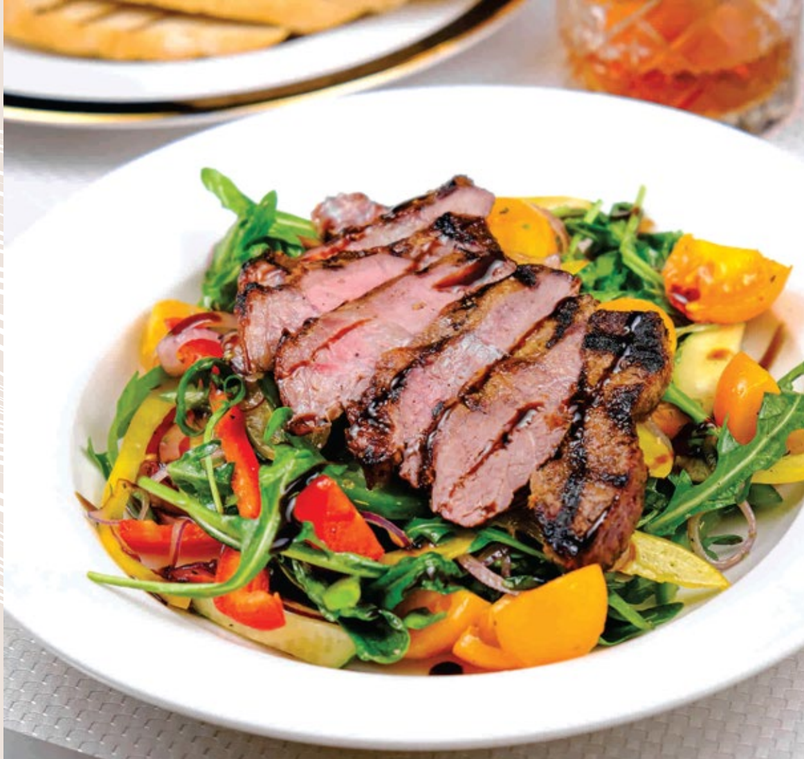
Стейк салат с овощами